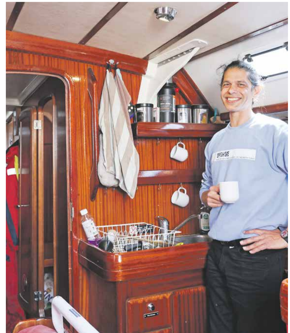
'Ik heb dit schip zodanig verbouwd dat het ook echt helemaal mijn project is geworden.'

'Mijn vader begrijp ik nu wel hoor. Ook zijn bedenkingen en zijn zorgen rond de regelgeving. Ik zou bijvoorbeeld twee reddingsvlotten kwijt moeten op dit schip. Waar laat ik die? 'Al met al is dat toch wel echt een droom die uitkwam. Al was het dan met wat vertraging. Inmiddels hebben we een dochtertje van zeven. Die vaart vrolijk mee. In de vakanties komt ze gezellig met mama aan boord en maken we mooie reizen. Dan noem ik haar altijd mijn co-schipper. Dat vindt ze geweldig.'