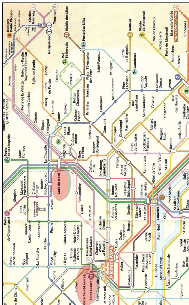
Metro kaart Parijs RER 'E' vanaf 'Gare du Nord' naar 'Gare Saint Lazare'

In Parijs moet u overstappen. U komt aan op 'Gare de Nord' en vanaf de stationshal loopt u naar de RER, een snelle metro, richting 'Gare saint-Lazare', dit is op de kaart de roze kleur. Vanaf hier neemt u de RER 'E' naar halte 'Gare saint-Lazare', dit is een rechtstreekse verbinding zonder tussenstops. Losse kaartjes voor de metro en RER kunt u bij een loket of automaat kopen, maar ook in de Thalys, (rijtuig 4, 14, 24). Kosten per persoon per enkele reis: € 1,60. Het is aan te raden het metrokaartje hier alvast aan te schaffen, omdat het bij de loketten in Paris Nord druk kan zijn.