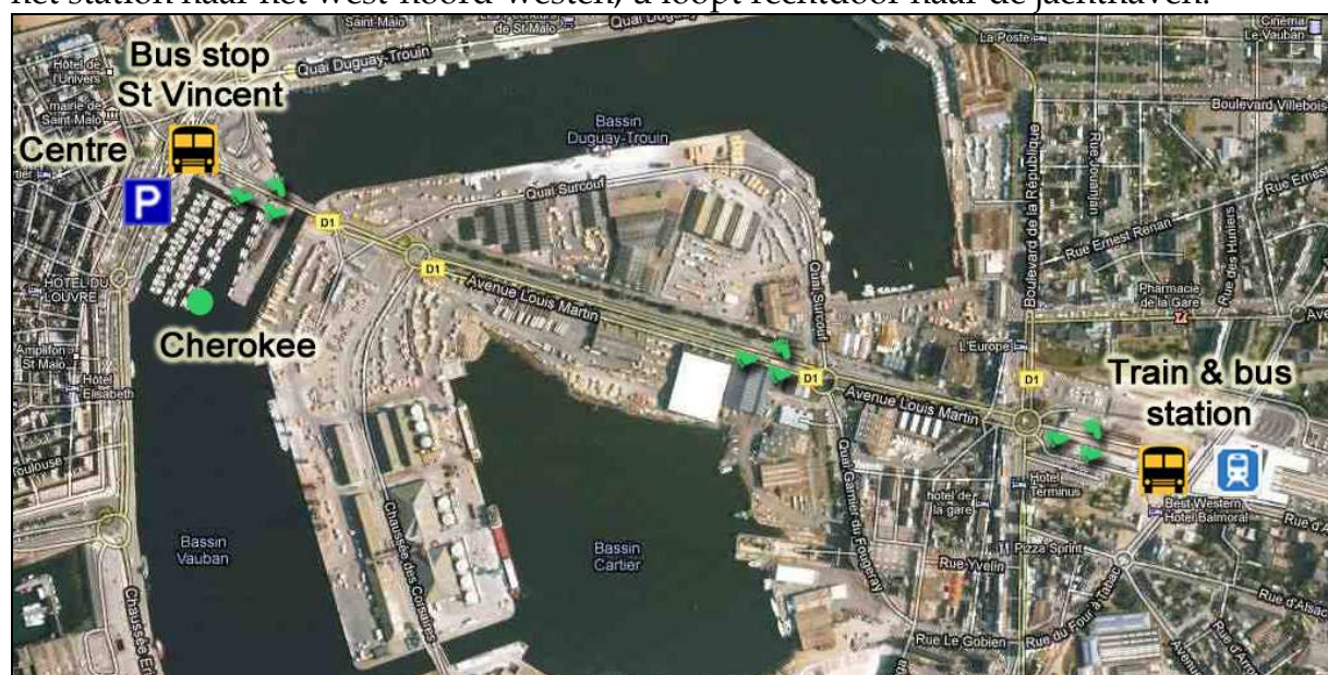
Kaart St Malo

Vanaf het treinstation is het ongeveer een halfuur lopen naar het schip. Loop vanaf het station naar het west-noord-westen, u loopt rechtdoor naar de jachthaven.